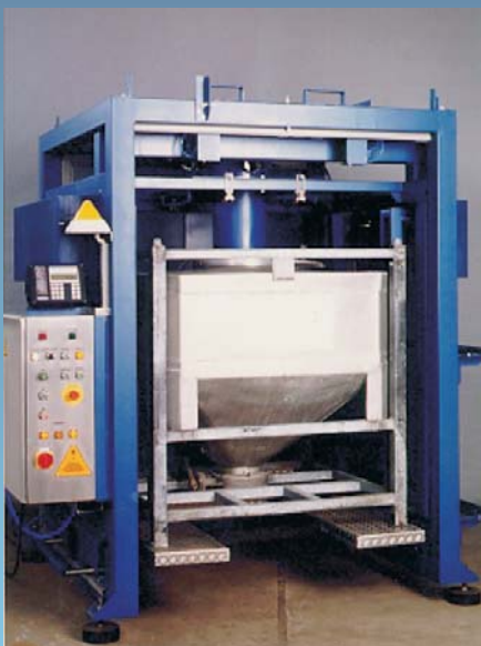
WAGNER-Abfüllanlage zum Befüllen von Containern.

Wenden Sie sich an unser Team von qualifizierten Fachkräften, damit wir auch Ihnen einen Lösungsvorschlag für Ihre individuelle Aufgabenstellung unterbreiten können.