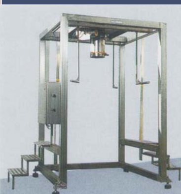
Einfaches Gestell ohne Waage in Edelstahlausführung.