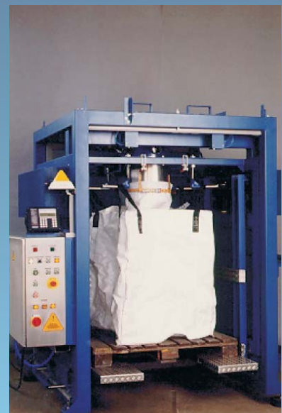
WAGNER-Abfüllanlage zum Befüllen von Big-Bags stehend.