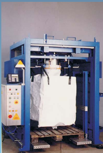
WAGNER-Abfüllanlage zum Befüllen von Big-Bags hängend.